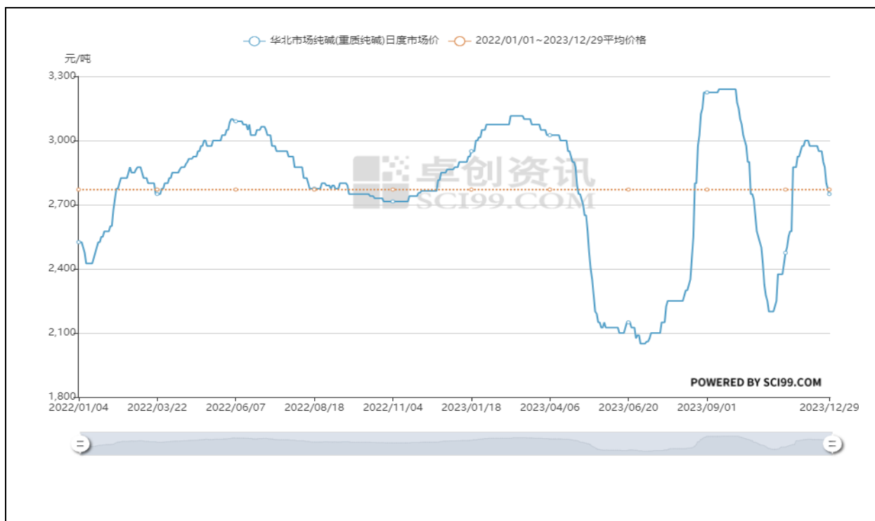
图 1：2022—2023 年华北市场纯碱日度市场价格趋势

石英砂市场情况。2023 年国内光伏玻璃用石英砂供给改善，价格下降。一方面，近几年石英砂酸洗技术趋向成熟，各地酸洗厂产能扩大，市场供给增加。另一方面，报告期进口石英砂大量增加，进一步促进石英砂价格降低。2023 年公司光伏玻璃用石英砂采购均价同比下降 13.55%。